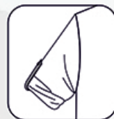
Manches kimono avec contraste